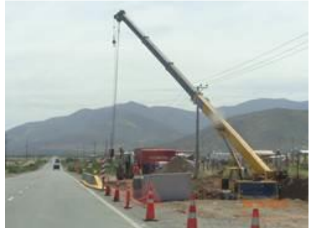
Instalación cajones prefabricados en tramo 1.4