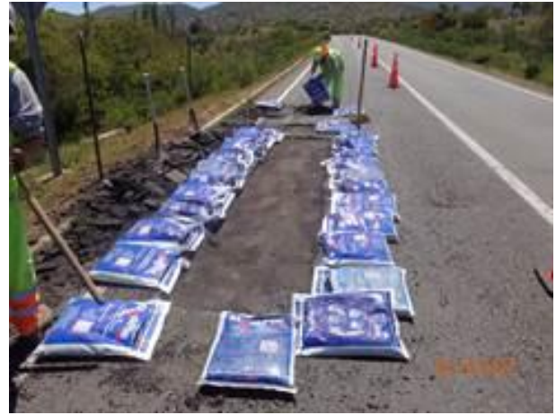
Reparación de baches y grietas