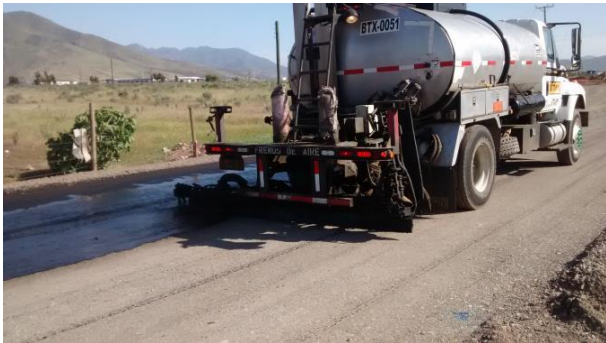
Trabajos Pavimentacion Desvio El Peñón..