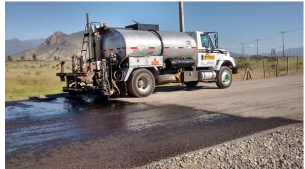
Trabajos Pavimentacion Desvio El Peñón.