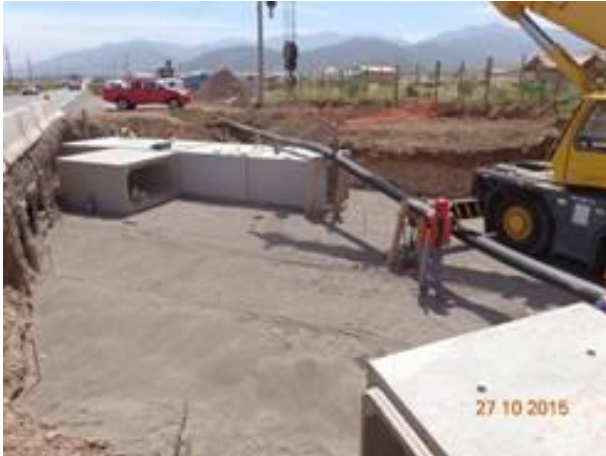
Instalación cajones prefabricados en tramo 1.4