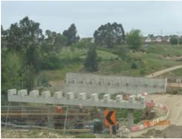
Trabajos de Enfierradura Estribo Puente La Laguna