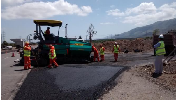
Trabajos Pavimentación Desvio El Peñon.