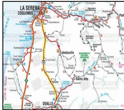
Emplazamiento Ruta 43 Concesionada.